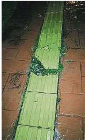
灵市17区17/13路的部分导盲砖已脱落，容易导致路人被绊倒。

不仅如此，就连一般人在晚上时段，也会因为视线不佳而看不清路况而跌倒。尤其近来不断下大雨，很多人都为了可以尽快回家而加快脚步，往往不会察觉到行人道上的状况，希望当局可以派员前来维修。”