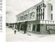
宝石戏院在70年代曾风光一时，是否

他表示，发展商目前的交通评估报告没有解决现有的交通阻塞，而该区可说是灵市最塞车的中心点之一，车流量来自百乐花园、SS2及大学路等方向。