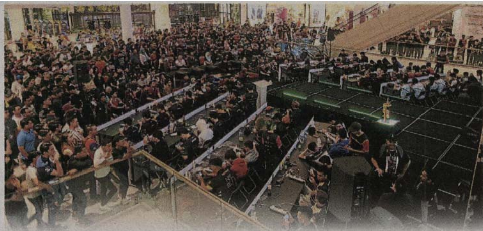
■一连两天的2019年雪州电竞赛事，吸引了众多电竞爱好者前来观赏。