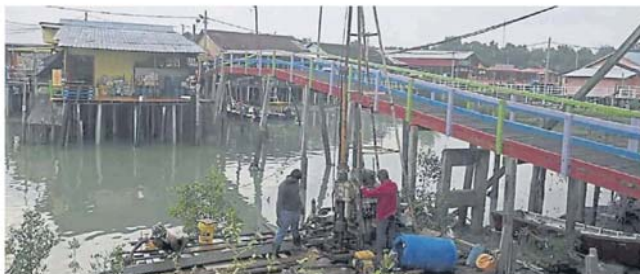
公共工程局兴建桥梁前，到有关建议地点进行土质测试。