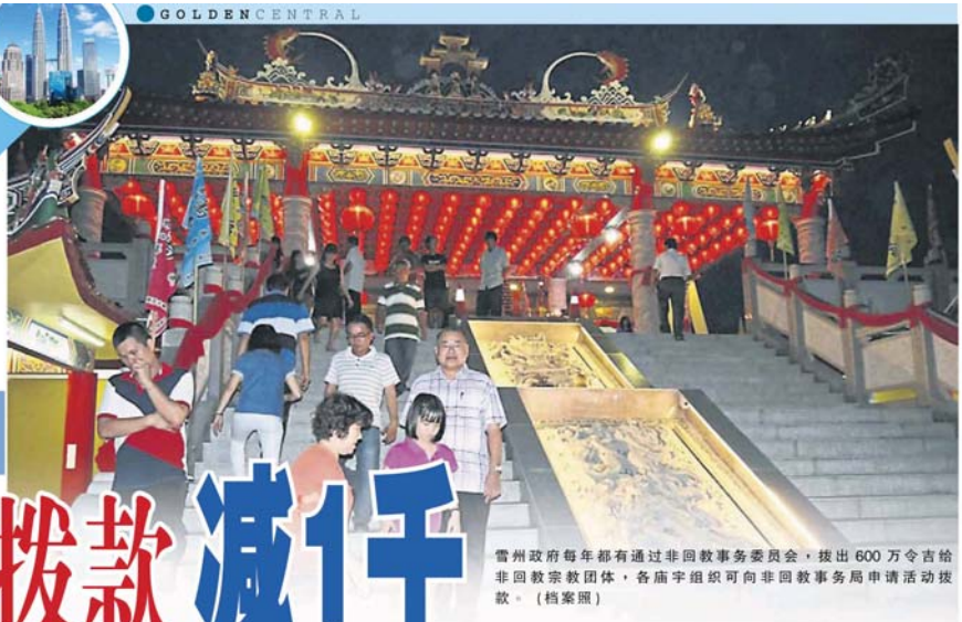
雪州政府每年都有通过非回教事务委员会，拨出 600 万令吉给非回教宗教团体，各庙宇组织可向非回教事务局申请活动拨款。(档案照)

询及是否将要求雪州政府增加相关拨款，他指明明年各方面预算与今年没太大差别，给非回教团体的拨款应该维持在 600 万令吉内。