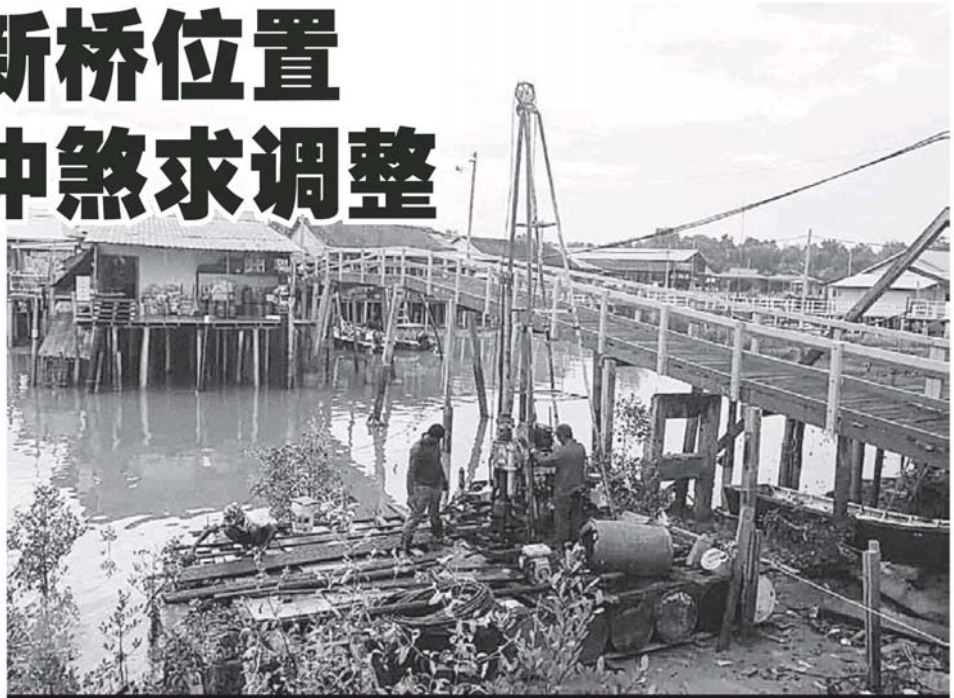
吉胆岛头条港新桥工程已启动，下个月将正式动工，技术人员目前正在当地进行土地测量。