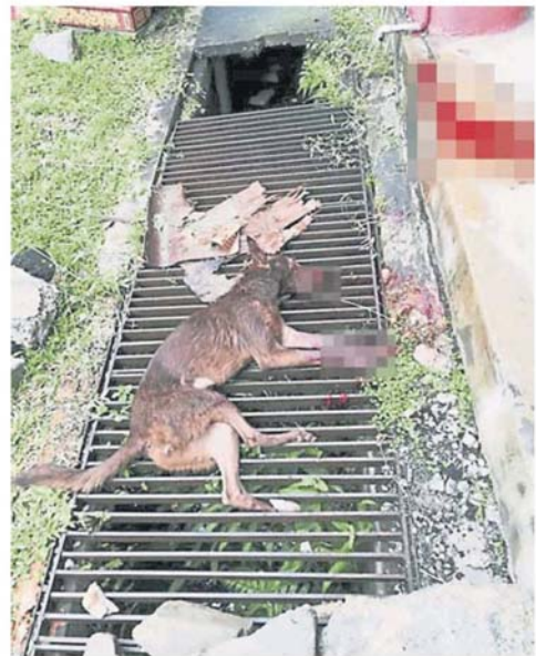
狗只死状骇人，让爱狗人士痛心疾首。

中毒。巴哈鲁丁指警方未掌握任何线索，暂时未找到看见 5 只狗被杀害的证人，现场也未发现任何弹壳。