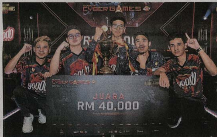
■Yoodo Gank队伍成功在15名队伍选手中脱颖而出，赢得冠军宝座。

电竞赛事也获雪州体育理事会、沙亚南市政厅、雪兰莪电竞协会、雪州地方青年推动委员会、马电讯及中企腾讯的支持与赞助。(TKM)