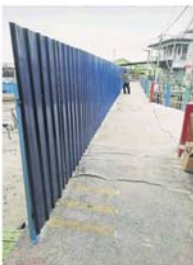
公共工程局确定新桥兴建地点后，便在该区设围篱。

他声明，上述建设工程是本身任职村长时，为村民争取的福利之一，并在公开会议上以大部分村民利益为重来作决定，个人并无任何私利或是政治目的。