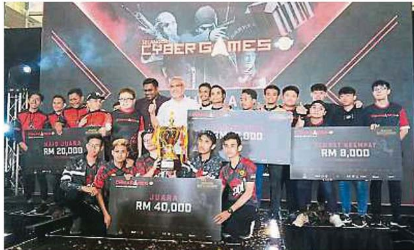
卡立沙末(后排左七)与获奖队伍合照。

(沙亚南28日讯) 2019年雪州电竞赛(Sukan Siber Selangor)一连两天在沙亚南Central i-City购物商场展开, 经过一番龙争虎斗, Yoodo Gank队成功在15名队伍选手中脱颖而出, 赢得冠军宝座。