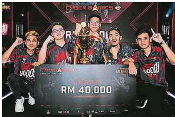
Yoodo Gank队伍成功在15名队伍选手中脱颖而出, 赢得冠军宝座。

电竞赛事获得雪州体育理事会、沙亚南市政厅、雪兰莪电竞协会、雪州地方青年推动委员会、马电讯及中企腾讯的支持与赞助。