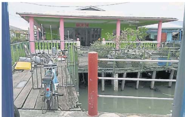
新桥对正大门口犯华人禁忌，吉胆岛头条港居民盼与当局协调“移位”。