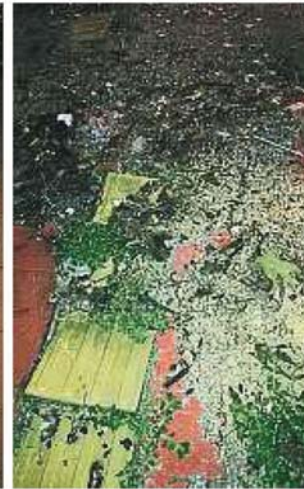
部分行人道上布满沙石，以致行人道上的部分导盲砖“被消失”。